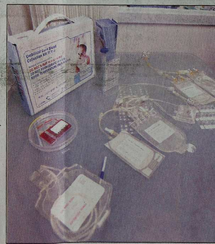
家長只需付約萬元便可為孩子儲存臍帶血樣本，以備日後作幹細胞治療之用。

香港紅十字會輸血服務中心發言人則指，中心自98年開始收集臍帶血，至今已儲存了約1,900個樣本，並為16名病人供應20個適合的樣本，其中9個已成功移植。